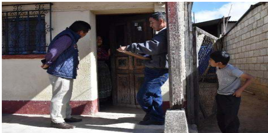
COBRO DE EXTRACCIÓN DE BASURA EN EL MUNICIPIO Y COMUNIDADES