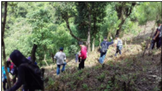
- Visita viceministro y ministro de ambiente