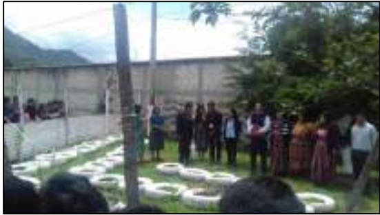
- Reforestación centro educativo