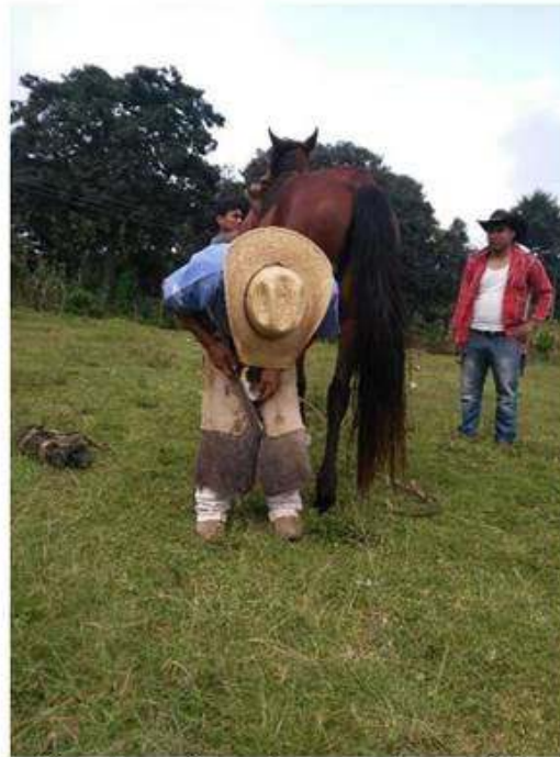
Limando y ajustando cascos de uno de los equinos.