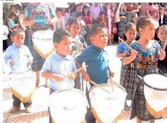
Desde pequeños se promueve la participación cívica.