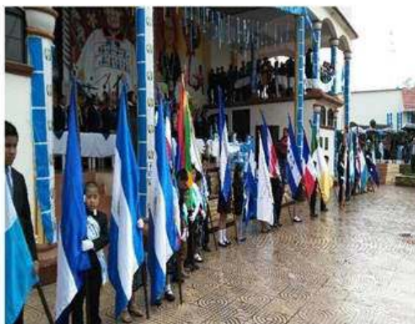
Grupo de niños