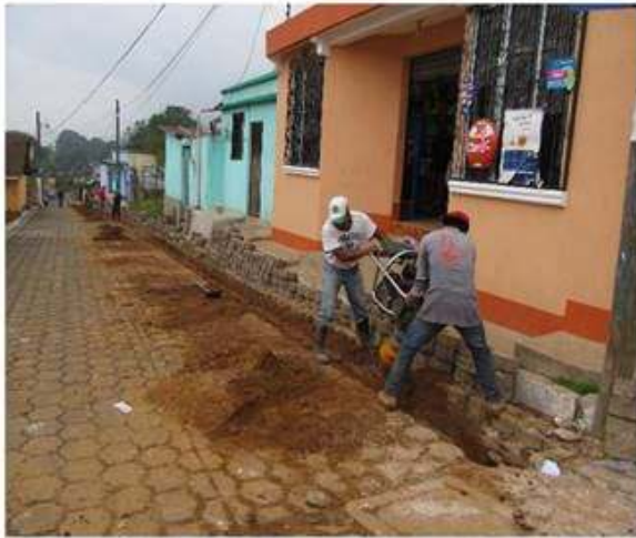
Arreglo del sistema de tubería de agua