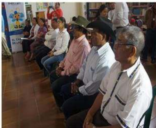
Concejo Municipal en la inauguración del programa.