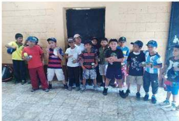
Grupo de niños con sus regalos.