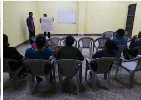
Socialización de resultados.