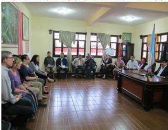
Distinguidos visitantes en despacho Municipal