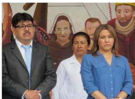
En la inauguración del Centro de Formación, con la presencia de la Primera Dama, Licda. Patricia Marroquin de Morales.