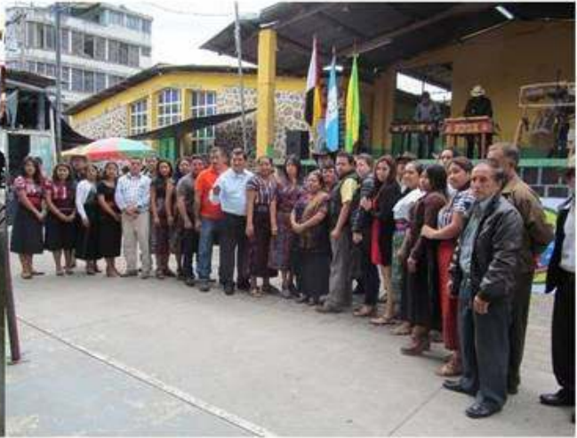
Artesanos y equipo de coordinación.