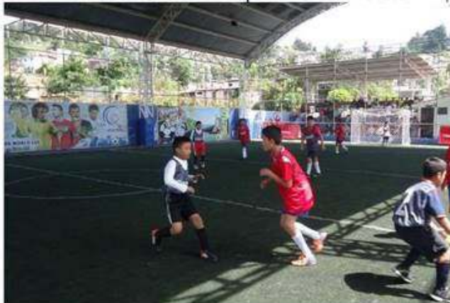
Escuela de Futbol Municipal participando en la COPA CLARO 2016 en el Departamento de Sololá