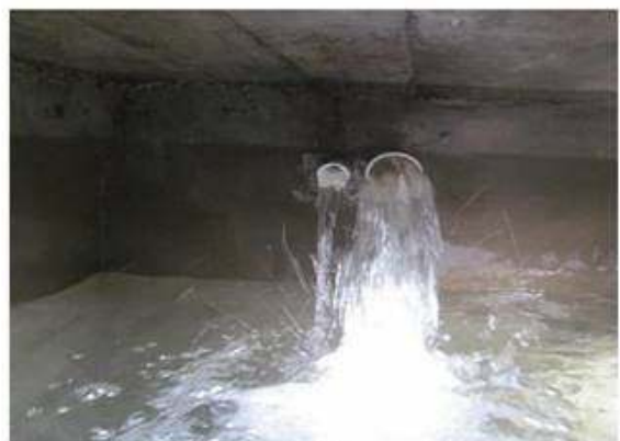
Caudal en caja de captación