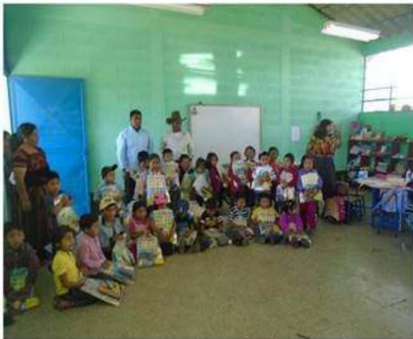
Grupo de niños de escuela primaria matutina sector Centro.