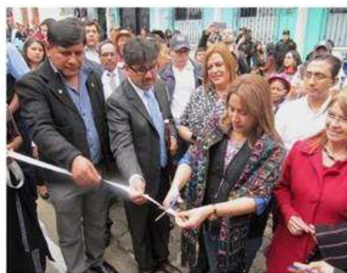
Momentos del corte, dando por inaugurado el centro de formación.