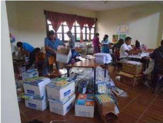
Preparativos para entrega de útiles.