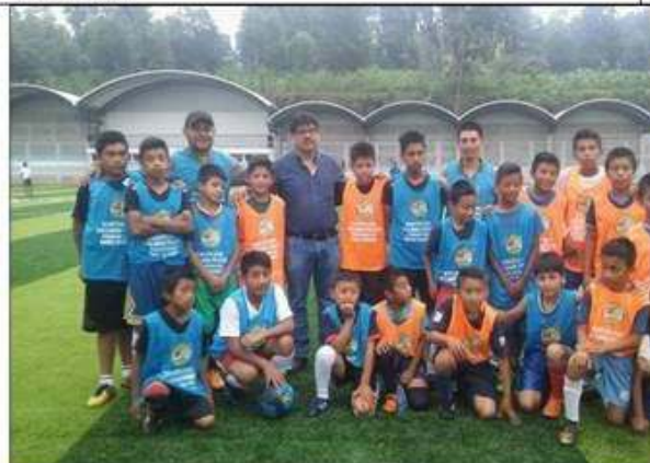
Escuela de Futbol Municipal Santa María Visitación