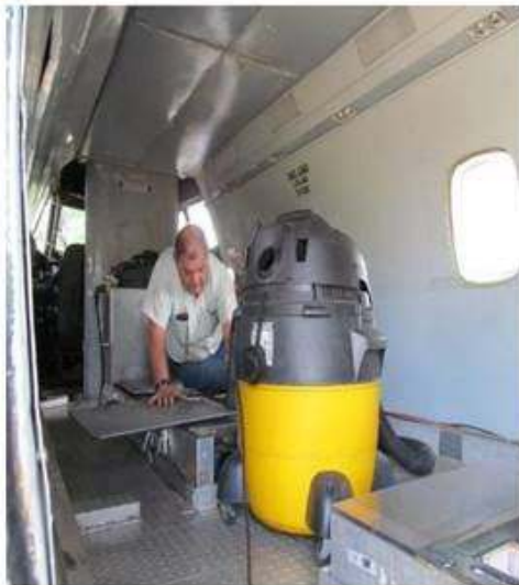
Técnico detallando proceso de vaciado de moscas en el vuelo.