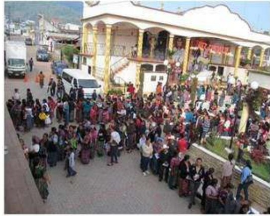
Grupos de vecinos organizados para recibir los alimentos.