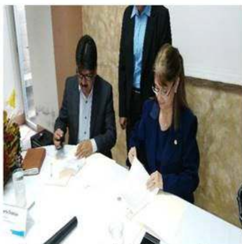
Firma del convenio de Cooperación en Secretaria Social de la Presidencia