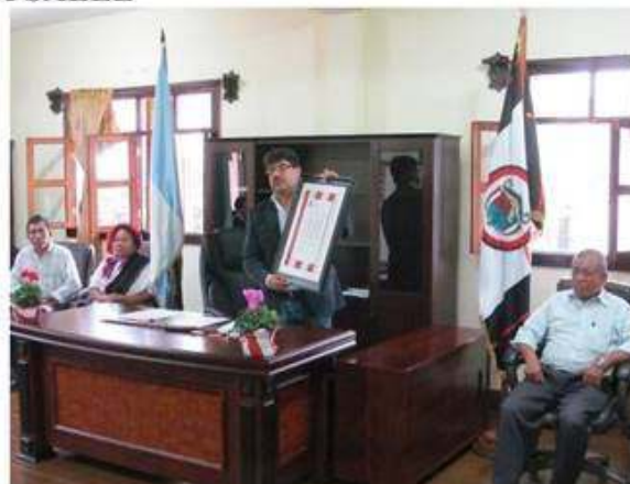
Alcalde Municipal en la entrega de reconocimiento a Hnos. De la Salle.