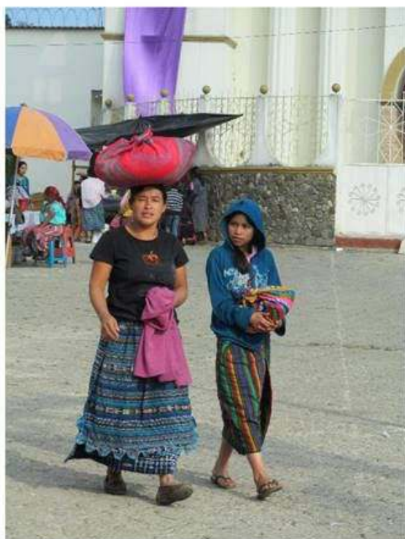
Dotación recibida por una madre de familia.