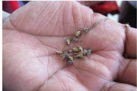
Moscas en etapa de hibernación.