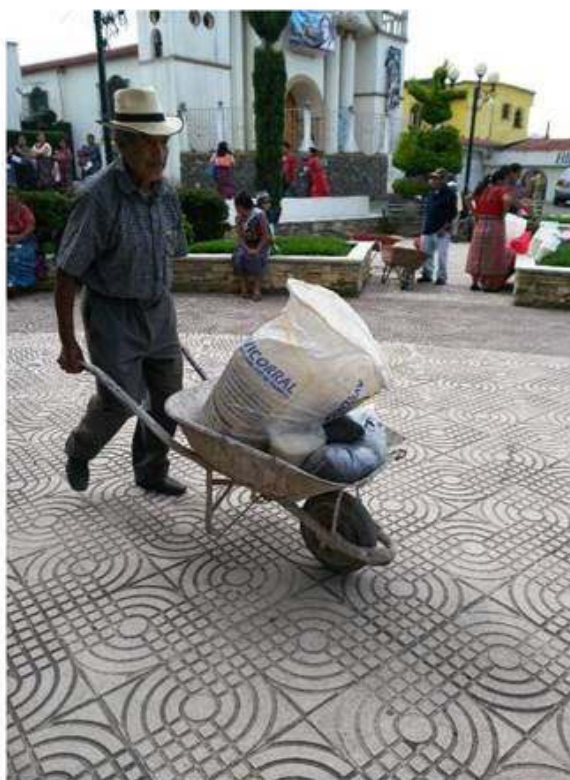
No importa el medio para llevarlo, lo que interesa tenerlo en bien de la familia.