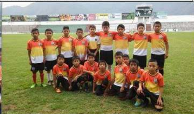
Visita de la Escuela Municipal a la Antigua Guatemala estadio Pensativo