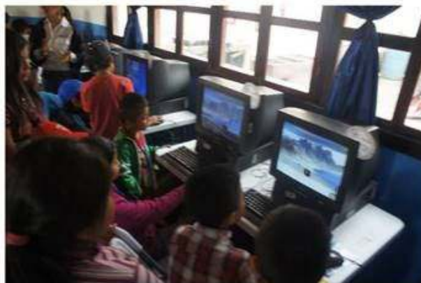
Grupo de niños haciendo uso ya de la tecnología.