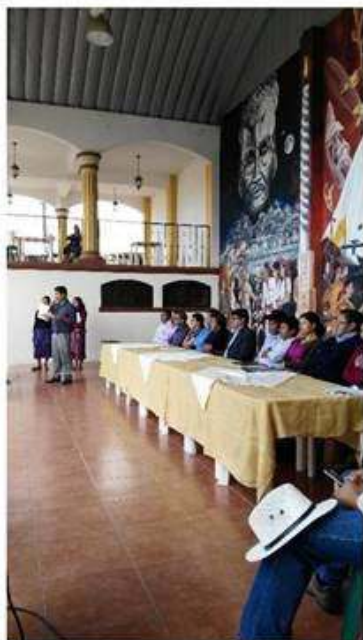
Presentación de Política Pública Municipal de Niñez, Adolescente y Adulto Mayor.