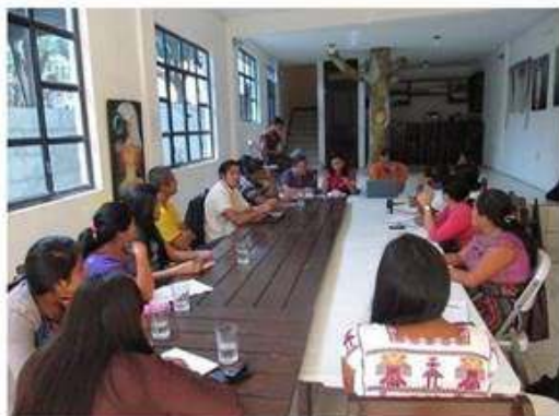
Presencia a Convocatoria para Unidades Municipales de parte Ministerio Cultura y Deportes.