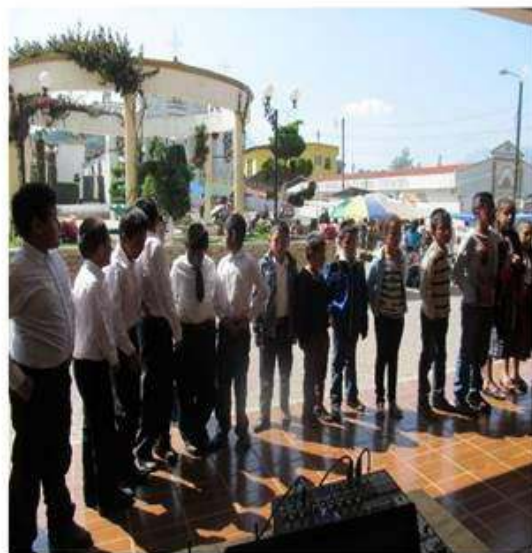
Parte del grupo de niños en la actividad.