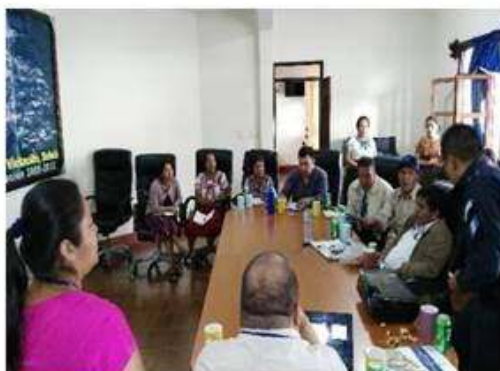
Reunión de trabajo con personeros con COREDUR, Quetzaltenango.