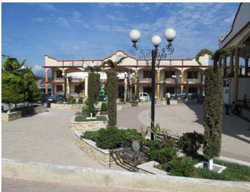
Imagen del parque ya con el recorte y ajustes realizados por personal municipal.