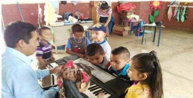
Niños recibiendo orientación musical de parte del instructor