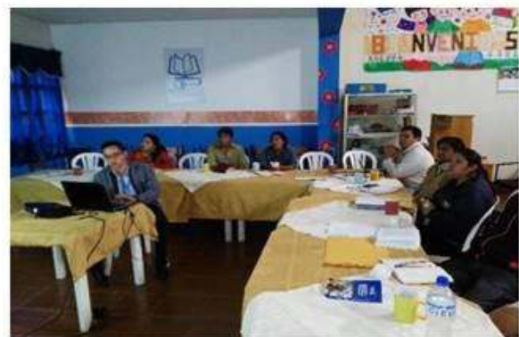
Explicación del tema de la organización.