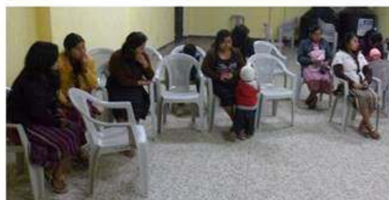
03/04/2016 Junta Directiva Montecristo.