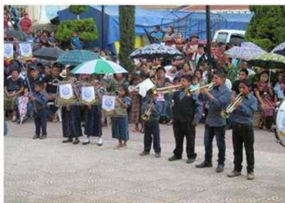
Alumnos de establecimiento de nivel primario.