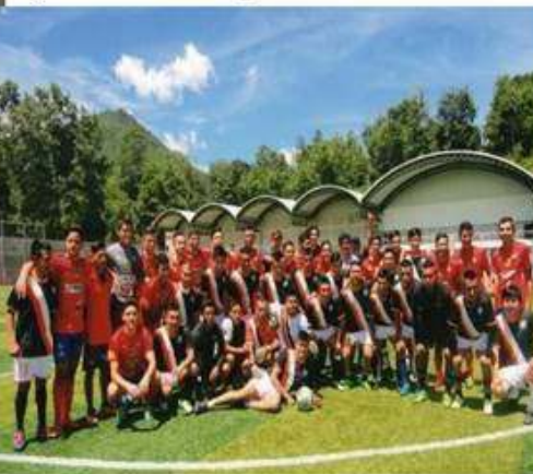
Encuentro futbolístico en la Feria titular contra la Especial de Municipal fc.