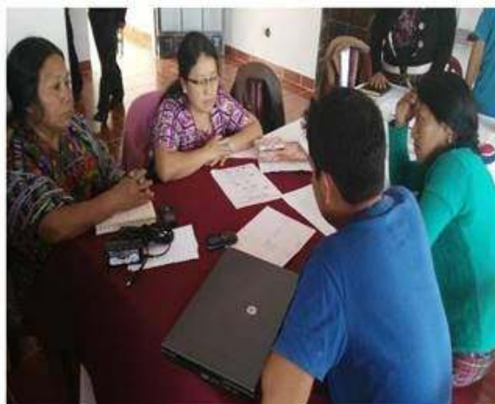
Grupo de trabajo en análisis de trabajo asignado.