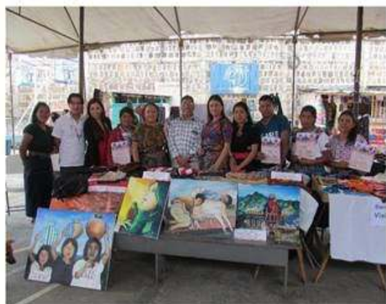
Artesanos de Santa María Visitación, en compañía de coordinadores.