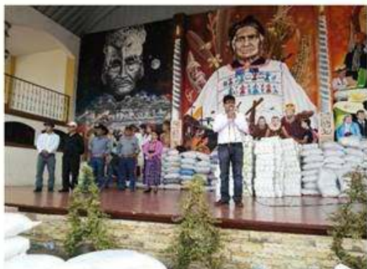
Alcalde Municipal dando pormenores de los compromisos de los beneficiarios.