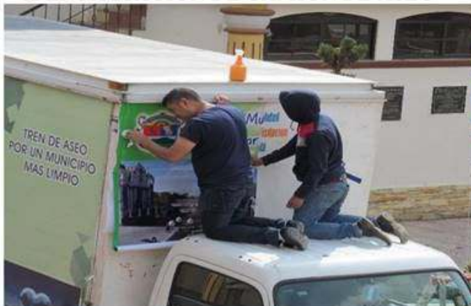
Colocación de stickers en camión de aseo.