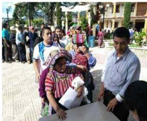
Presentación documentación para recibir la dotación de alimentos.