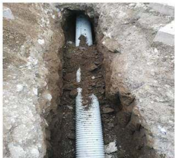
Nueva tubería instalada.