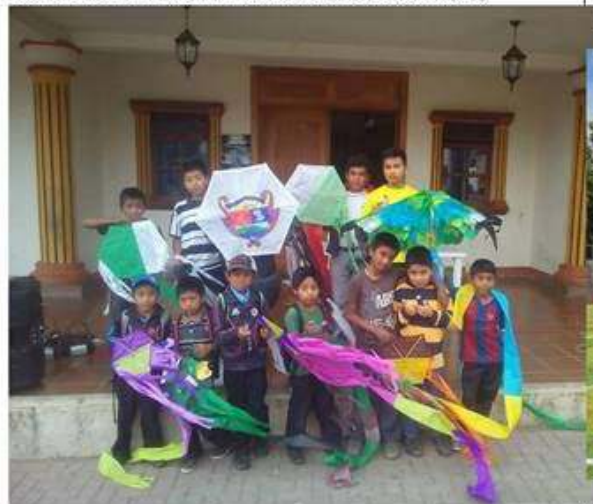
Concurso de Barriletes noviembre de 2016