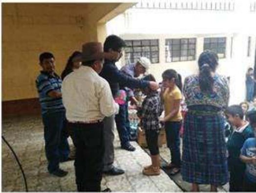
Alcalde Municipal en entrega de regalos a alumnos.