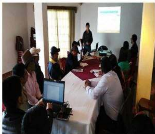
Parte del grupo en atención de especialista