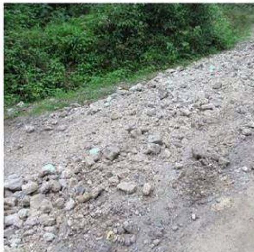
Presentación del acceso a Caserío de Chuipoj.