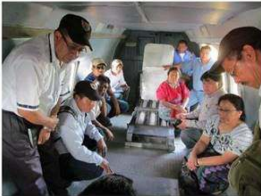
Concejo Municipal escuchando orientaciones en avión del programa.