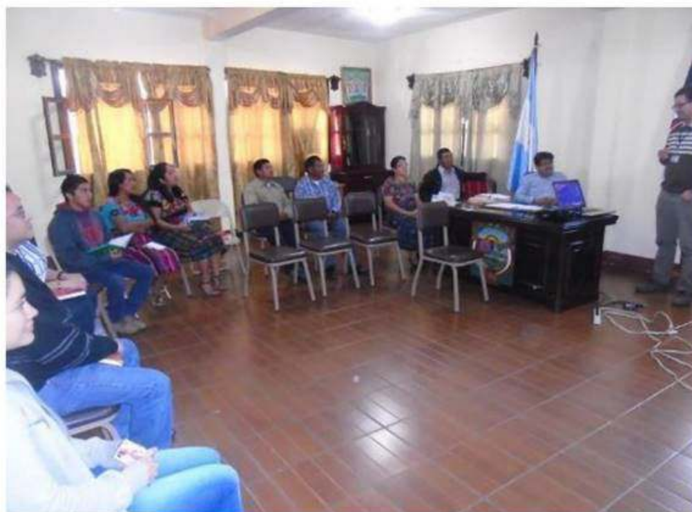
Socialización de resultados finales