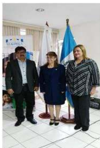
Alcalde Municipal en compañía de autoridades de la Secretaría.