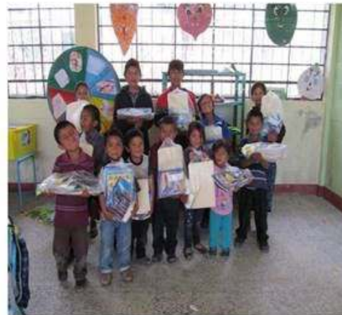
Alumnos de Chuipoj con sus útiles escolares.