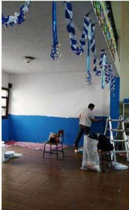
Pintando el área donde funcionará el programa de biblioteca con energía.