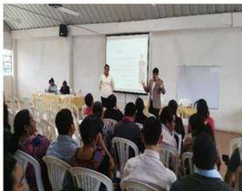
Presentación de objetivos programa con docentes.