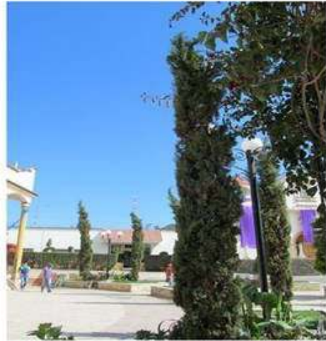
Cipreses en su estado natural