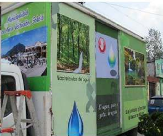
Camión de aseo con nueva imagen para el servicio público.