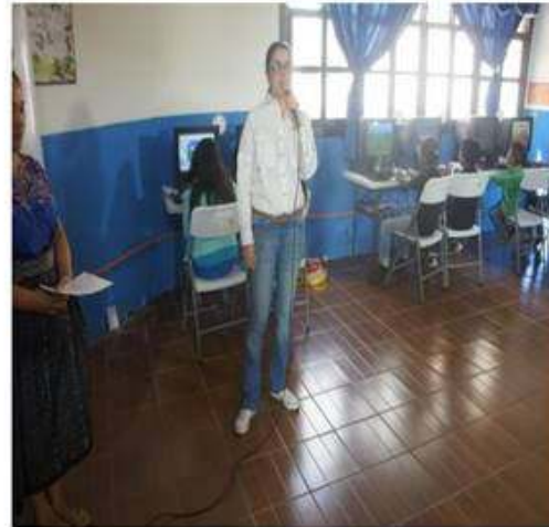
Intervención de delegada de ENERGUATE previo a la inauguración.