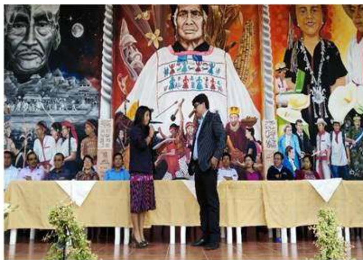
Momento de la recepción del documento de Política Pública Municipal.