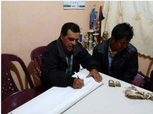
Grupo en el análisis FODA de la comunidad.