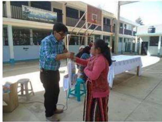
Momento de entrega por el Sr. Alcalde a una alumna del básico.