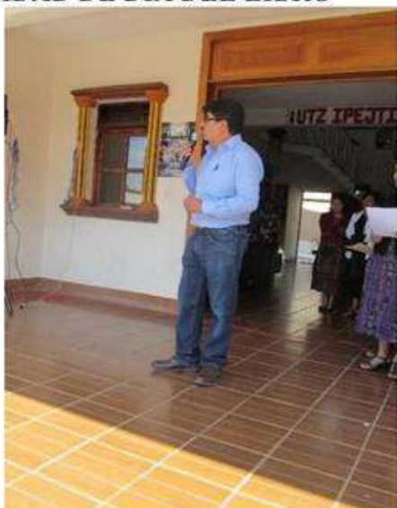
Alcalde Municipal dirigiéndose a los asistentes