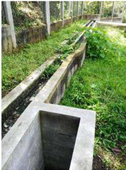
Aspecto de las plantas, en falta de mantenimiento.