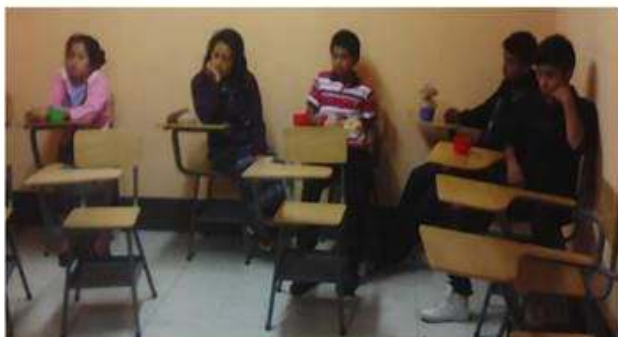
17/03//2016 Junta Directiva Palax