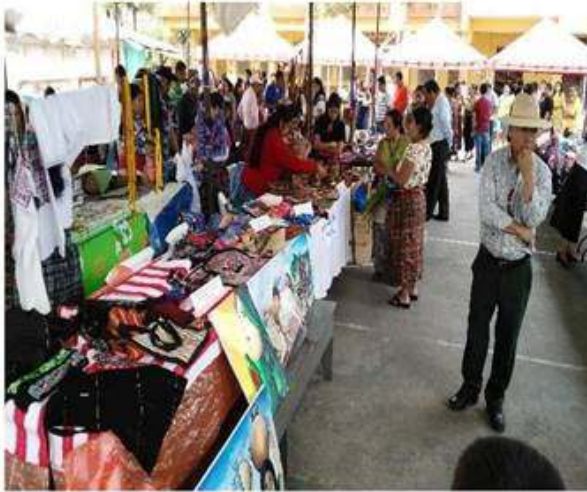
Exposición de las artesanías