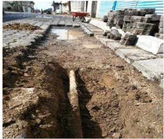
Situación de tubería para reparación.