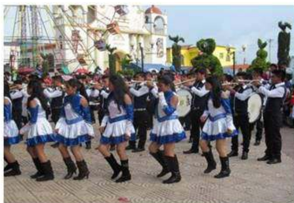
Alumnos del diversificado en su presentación.