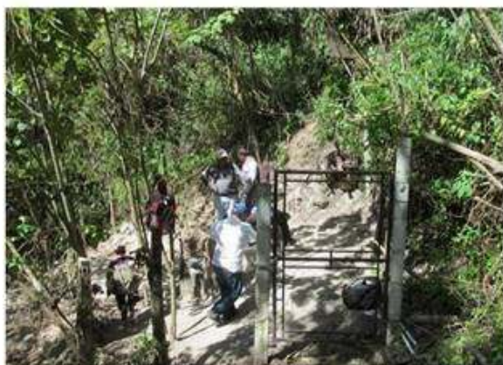
Autoridad Municipal verificando los trabajos.