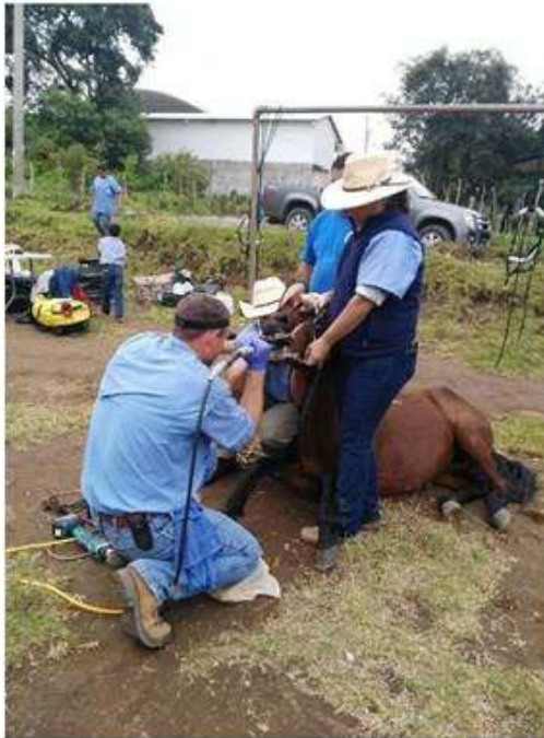
Limpieza a uno de los caballos por personal especializado.