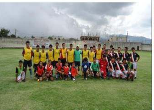
Visita al Municipio de Patzitzia del departamento de Chimaltenango