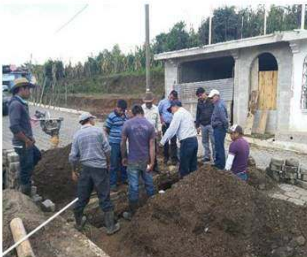
Autoridad Municipal verificando los trabajos.