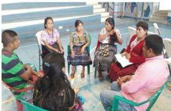
Grupo de trabajo en el primer taller de artesanía Tzutujil.