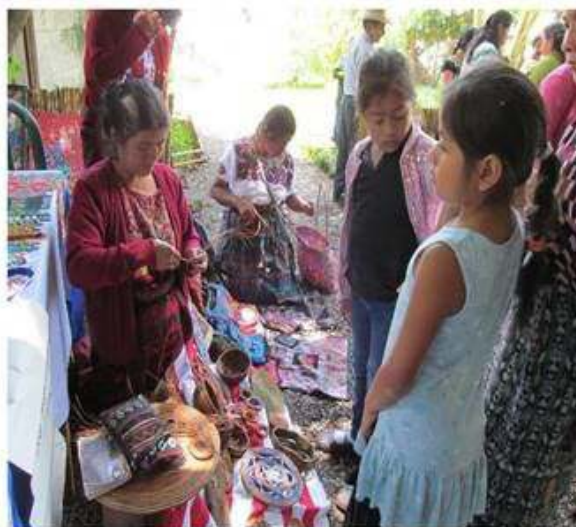
III Festival, exposición