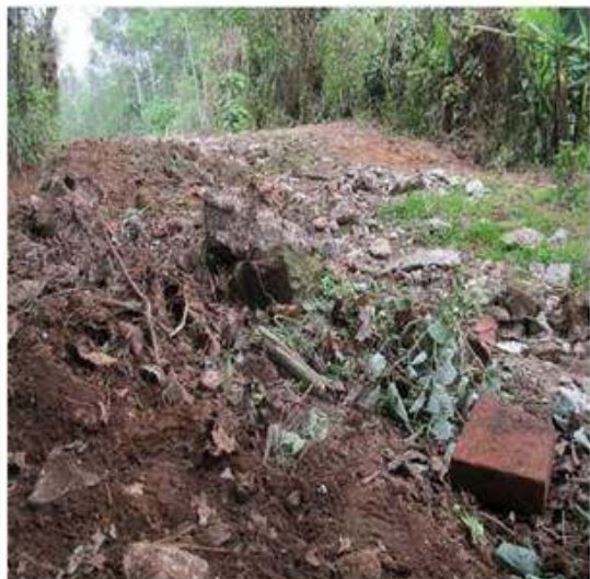
Estado de camino vehicular.