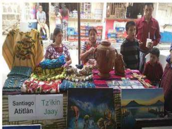
Parte de exposición en el festival de artesanía Tzutujil.