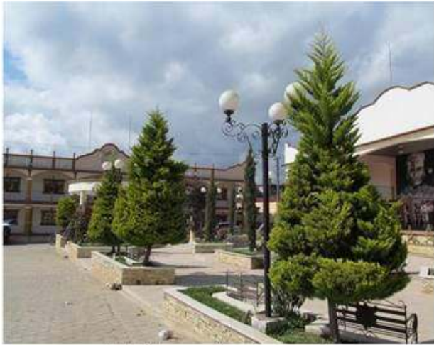
Arbolitos previos a su arreglo.