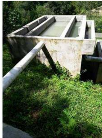
Reposadera con aguas contaminadas.