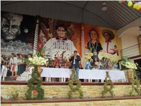
En la segunda entrega de alimentos, Alcalde Municipal explicando bondades del programa.