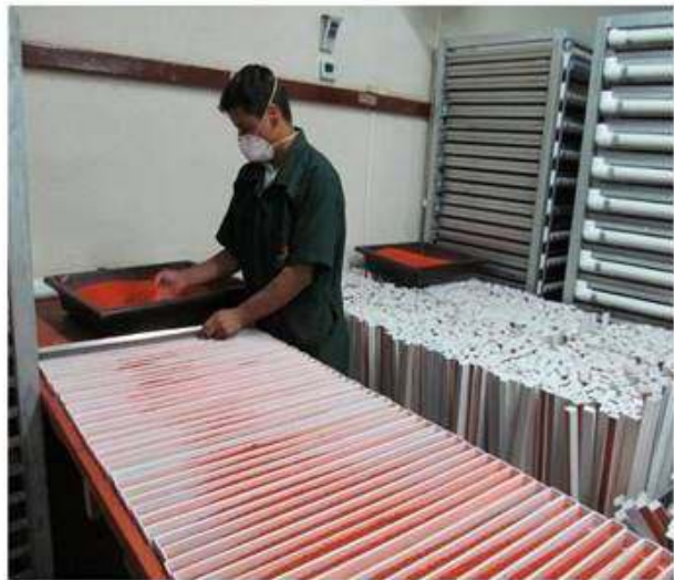
Planta de procesamiento y colocación de alimentos en bandejas.