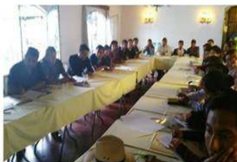
Recibiendo orientaciones para la formulación de proyectos culturales, Chichicastenango. Julio 2016.