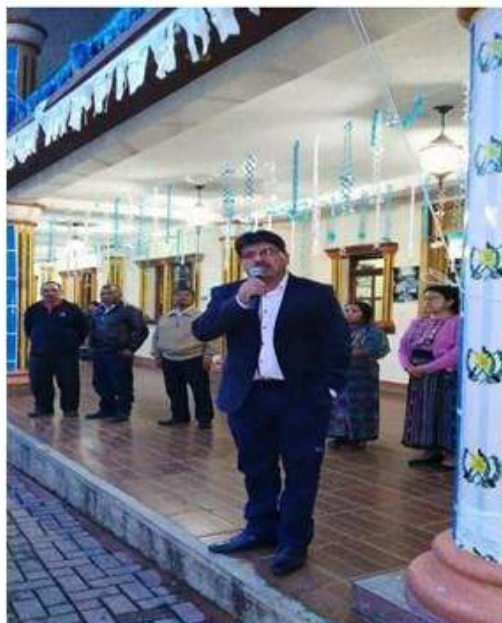
Alcalde Municipal en alocución de las festividades patrias en corredor Municipal